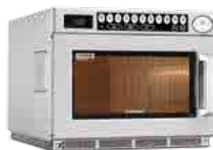
1529A - 1929A