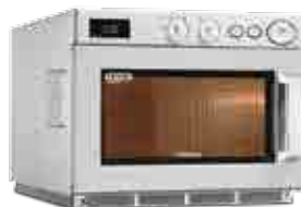
1519A - 1919A