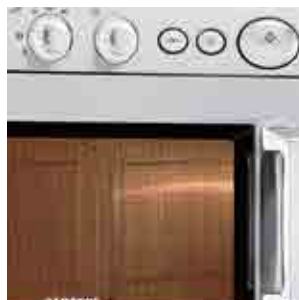
Comandi 1519A - 1919A 1519A - 1919A controls