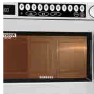
Comandi 1529A - 1929A 1529A - 1929A controls